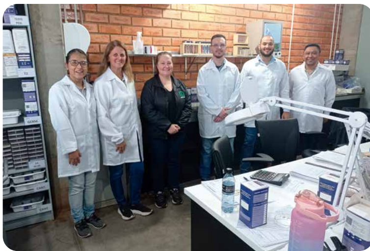
Equipes do LAS realizaram encontros In company em diversas empresas ao longo de 2024