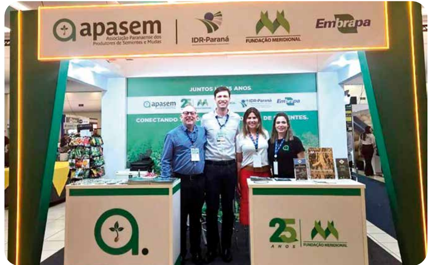
Apasem presente nos principais eventos do setor sementeiro ao longo de 2024

“Essa agenda cheia demonstra que a representatividade da Associação, que cresce a cada ano, não é fruto do acaso, mas sim de