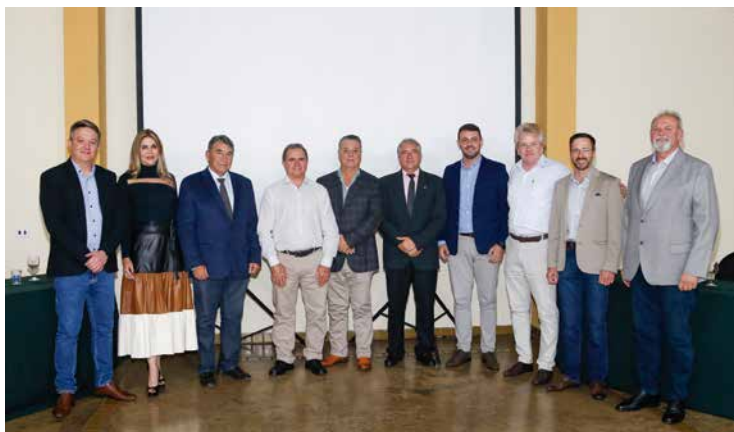
Direção Apasem 2023-2025

Agradecemos ao time de diretores, colaboradores e parceiros em diferentes esferas por entenderem e viverem a causa da Apasem. Somente com trabalho alinhado e focado nos objetivos é que conseguimos alcançar os resultados. Nosso muito obrigado por este período de tantos resultados.